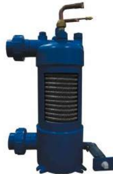
Echangeur en titane avec tube twisté Titanium warmtewisselaar met een buis "twisted"